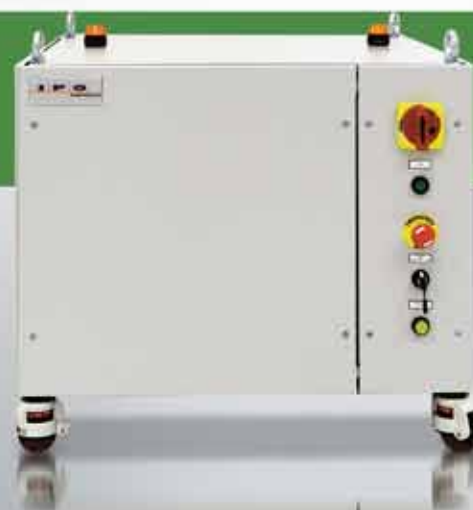
Серия YLS 2000